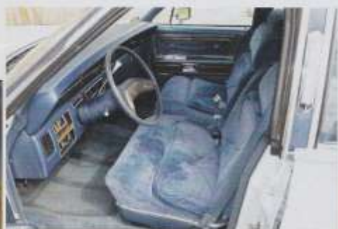
Bei Continental-Modellen mit Town-Car-Ausstattung waren die Bezüge der Lounge-Sessel wie Sofakissen gestaltet