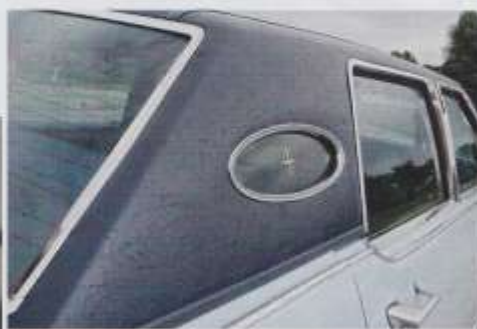
Zum Modelljahr 1975 wurde das Dach des Continental überarbeitet, gleichzeitig erhielt das Modell Opera Windows

dersitze, das war's. Details wie Fender Skirts, Opera Windows in den C-Säulen und Coach Lamps an den mittleren Dachpfosten, die früher ein Auto zum Luxus-Schlitten adelten, sind auch gegen Aufpreis nicht mehr zu bekommen. 1975 dagegen gehörten die ovalen "Bullaugen" mit dem eingefrästen Lincoln-Logo zur Serienausstattung des Continental, die seitlichen "Kutschenlaternen" waren dagegen Teil des Town-Car-Paketes.