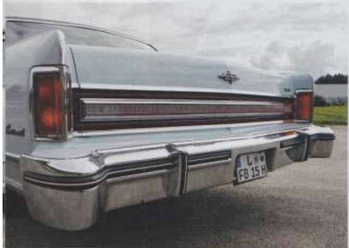
Die Rückleuchten wurden gegenüber dem Vorjahr markanter geformt

Hinter dem Namen Town Car verbarg sich seinerzeit eine Sonderausstattung, die der wohlhabende Kunde gegen einen Mehrpreis von 635 US$ zu seinem Lincoln Continental, der mit 9.656 US$ zu Buche schlug, hinzubestellen konnte. Erst ab dem Modelljahr 1981 wurde aus dem Town Car ein eigenständiges Modell, während der Name Continental 1982 für ein wesentlich kleineres Lincoln-Modell wiederverwendet wurde. Neben den bereits erwähnten Merkmalen enthielt die Town-Car-Ausstattung elektrisch versenkbare Dreiecksfenster an den vorderen Türen, die auch "Raucherfenster" genannt wurden. Ob der hellblaue Koloss jemals blauem Dunst ausgesetzt war, darf bezweifelt werden, denn das plüschige Interieur zeigt sich in tadellosem Originalzustand. Auch im Innenraum weist das Town Car einige Besonderheiten gegenüber dem normalen Continental auf: Außer dickeren Teppichen, anderen Türverkleidungen und einem goldfarbigen Schriftzug am Armaturenbrett, gehörten elektrisch verstellbare Lounge Sessel zum Ausstattungsumfang, die in einem besonders bequemen Sofakissen-Design ("floating" Pillow-Design) gestaltet waren. Ebenso gut erhalten wie das Innere zeigt sich auch die in Medium Pastel Blue lackierte Karosserie: "Der Wagen wurde in