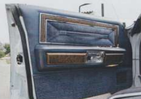
Die Einsätze der Türverkleidungen wurden auf die Sitze abgestimmt