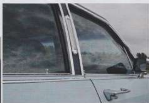
Die Coach Lamps wurden mit dem Licht eingeschaltet und dienen ausschließlich dekorativen Zwecken