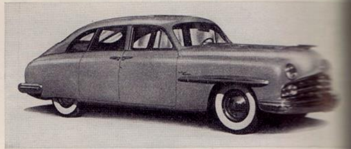
LINCOLN COSMOPOLITAN TOWN SEDAN

Dimensions, poids, performances: 308 cm., voie AV 148,6 cm., h. 152,4 cm., diam. de braqu. 13,7 m., long. 641 cm., larg. 194,5 cm., haut. 161,5 cm., g. 1815 kg., 6 places, poids 1815 kg., consommation env. 19 L/100 km*, vitesse max. env. 185 km/h*. *) Donnée approx. fournie par la rédaction.