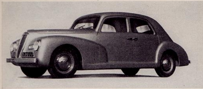
LANCIA APRILIA BERLINE PININ FARINA